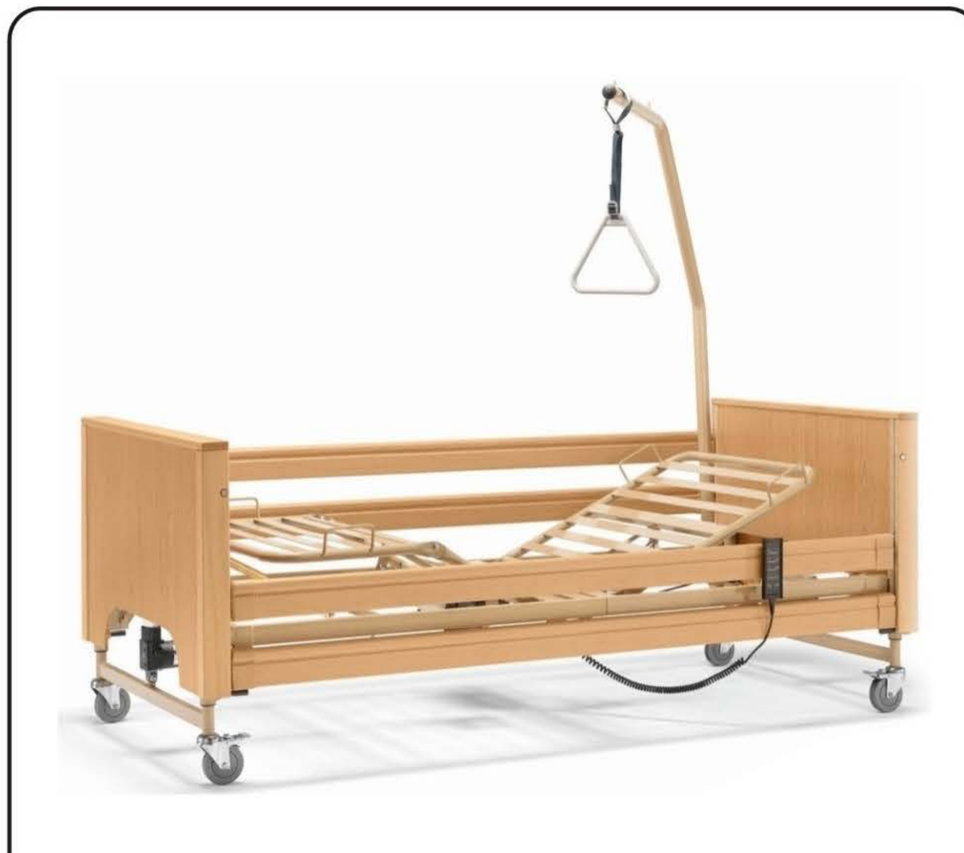
Letto ospedaliero elettrico