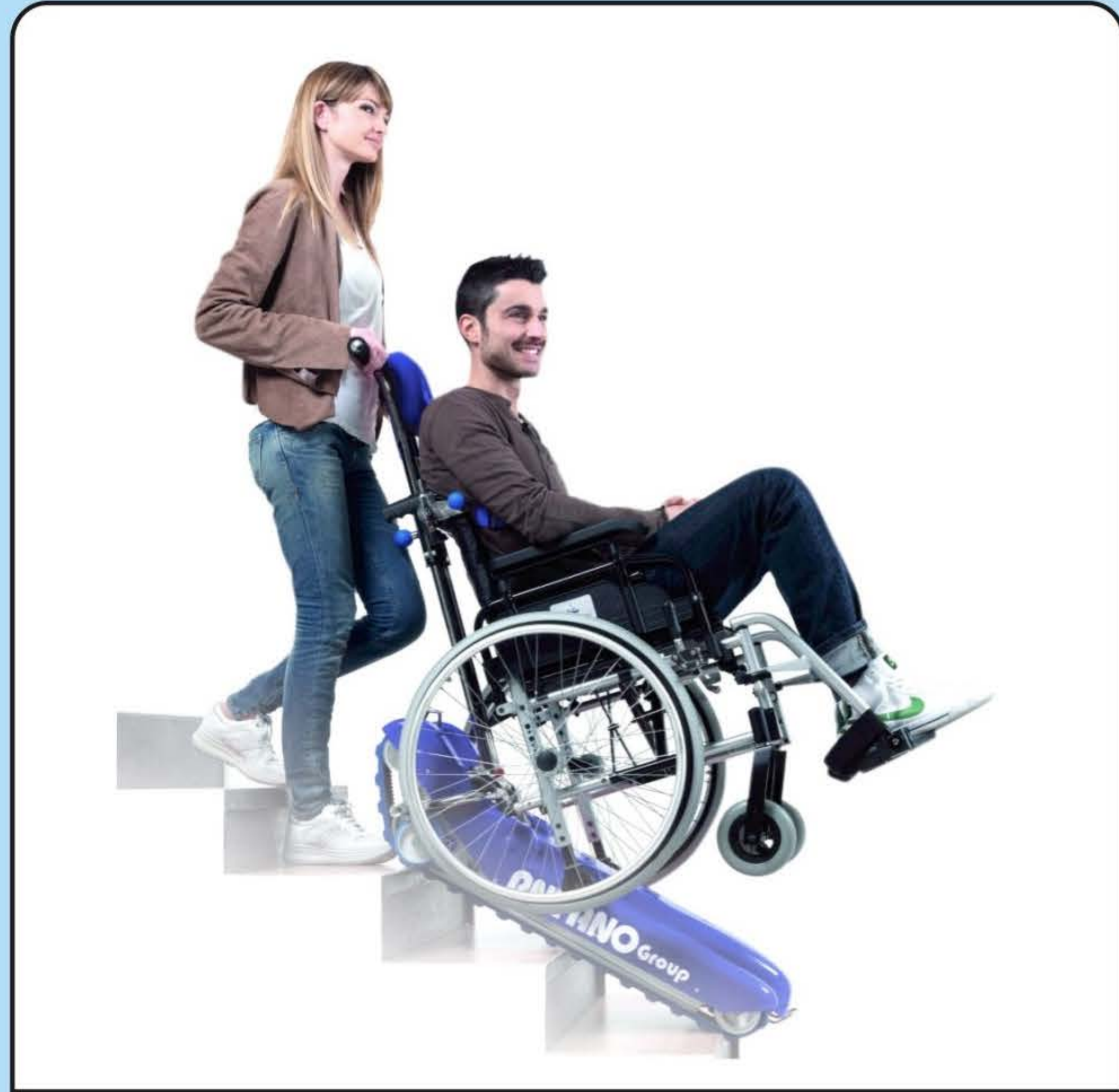
Montascale a cingoli