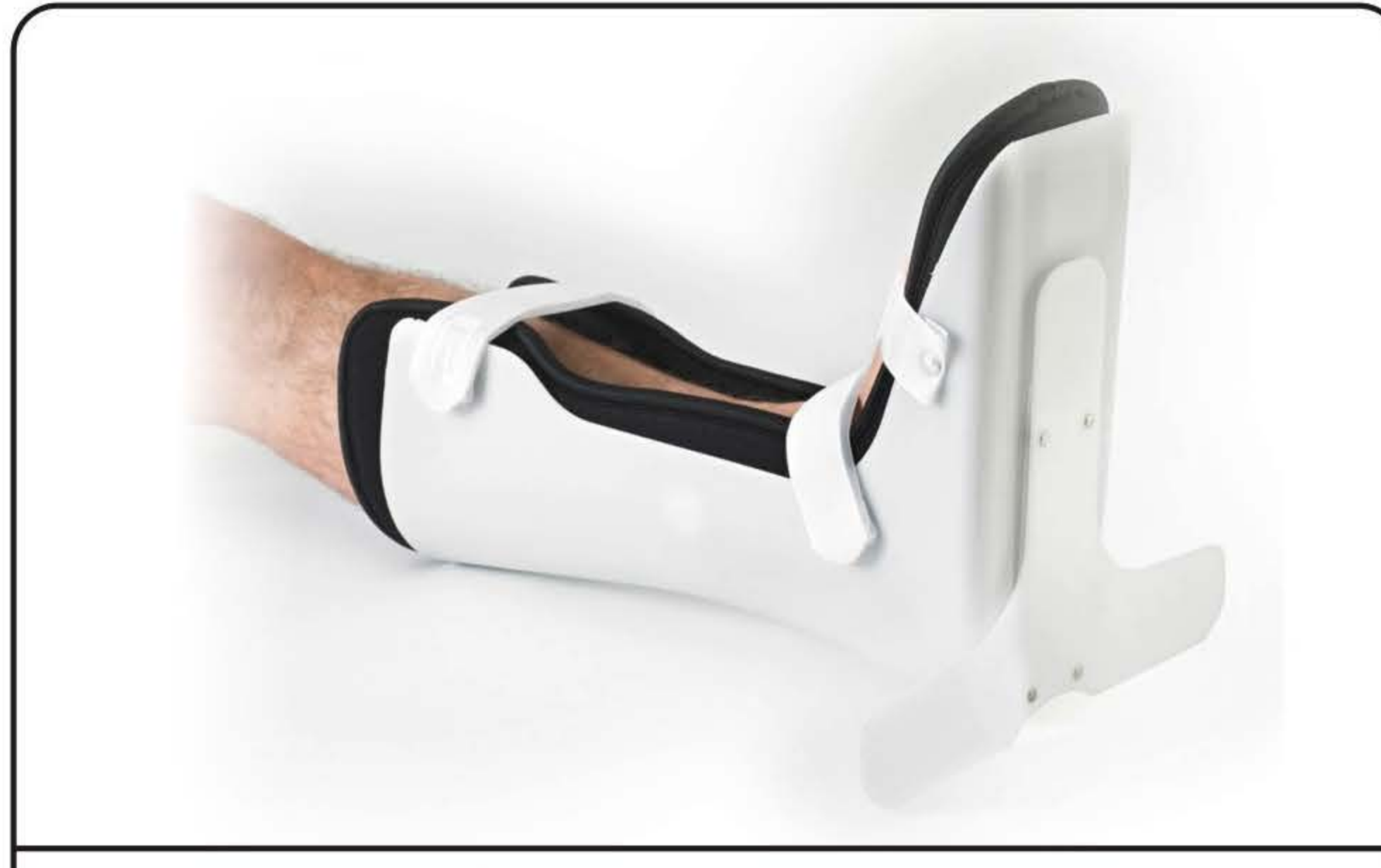
Gambaletto di posizione