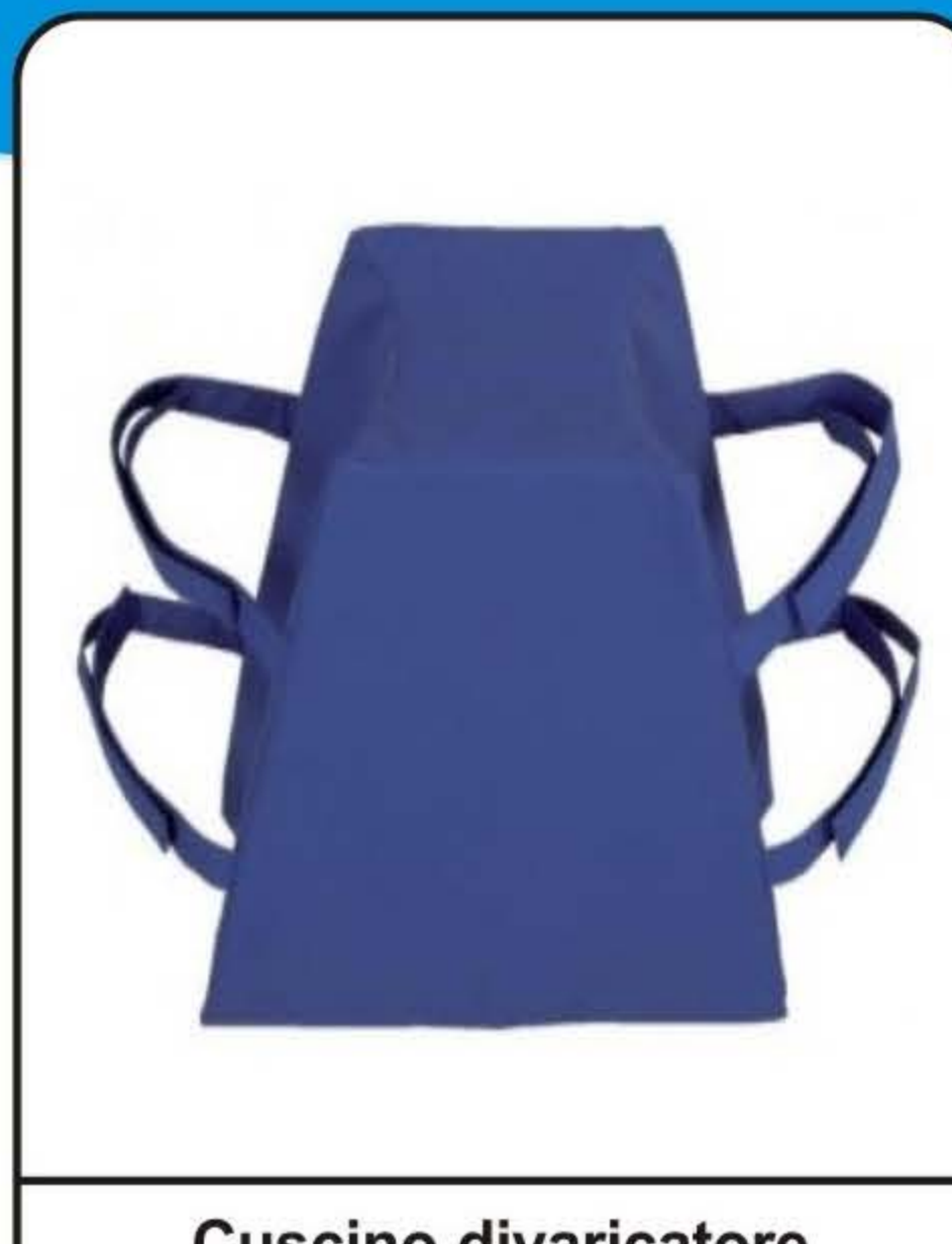
Cuscino divaricatore inguinale