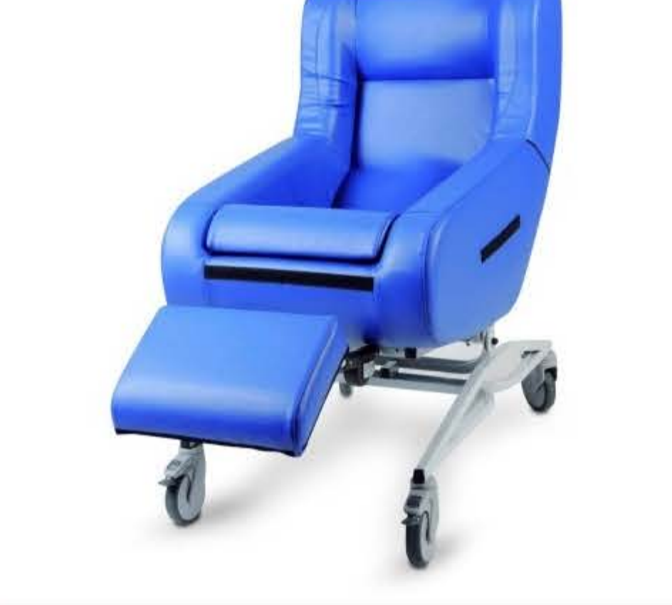
Poltrona relax geriatrica