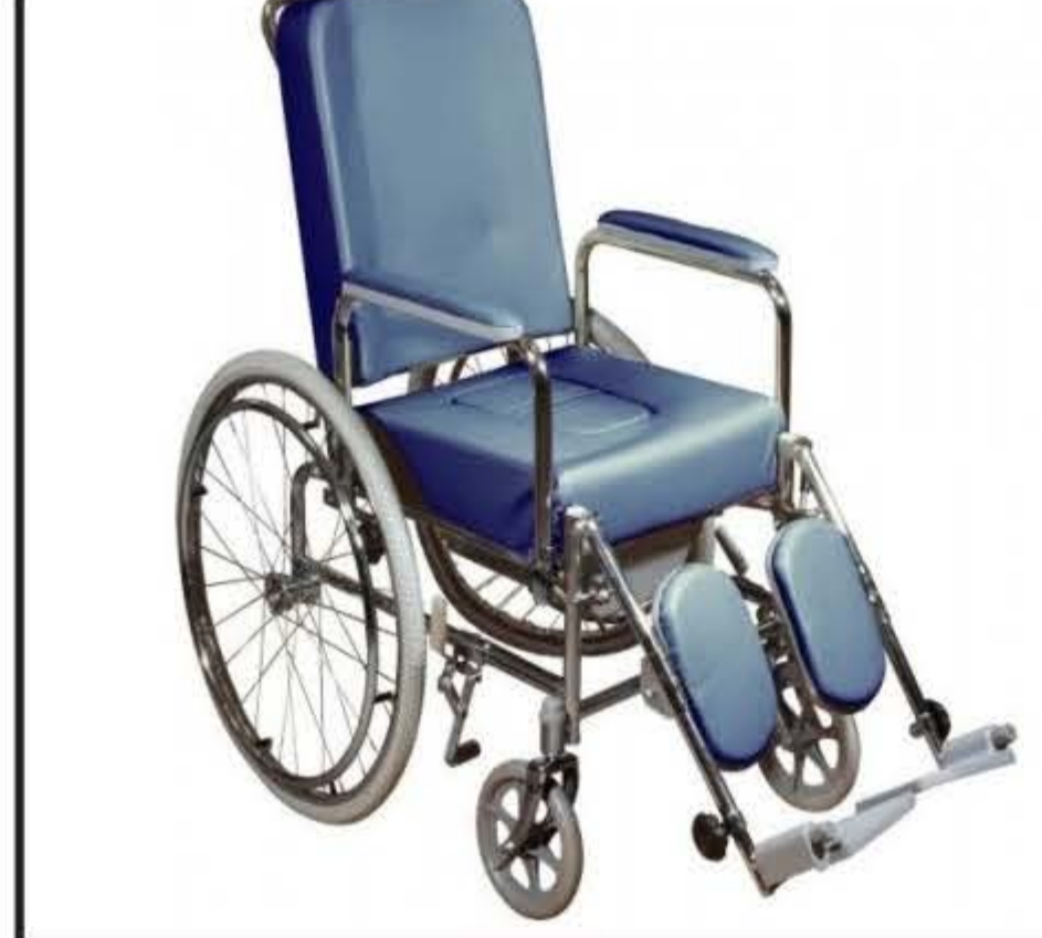
Carrozzina rigida in autonomia o con assistente