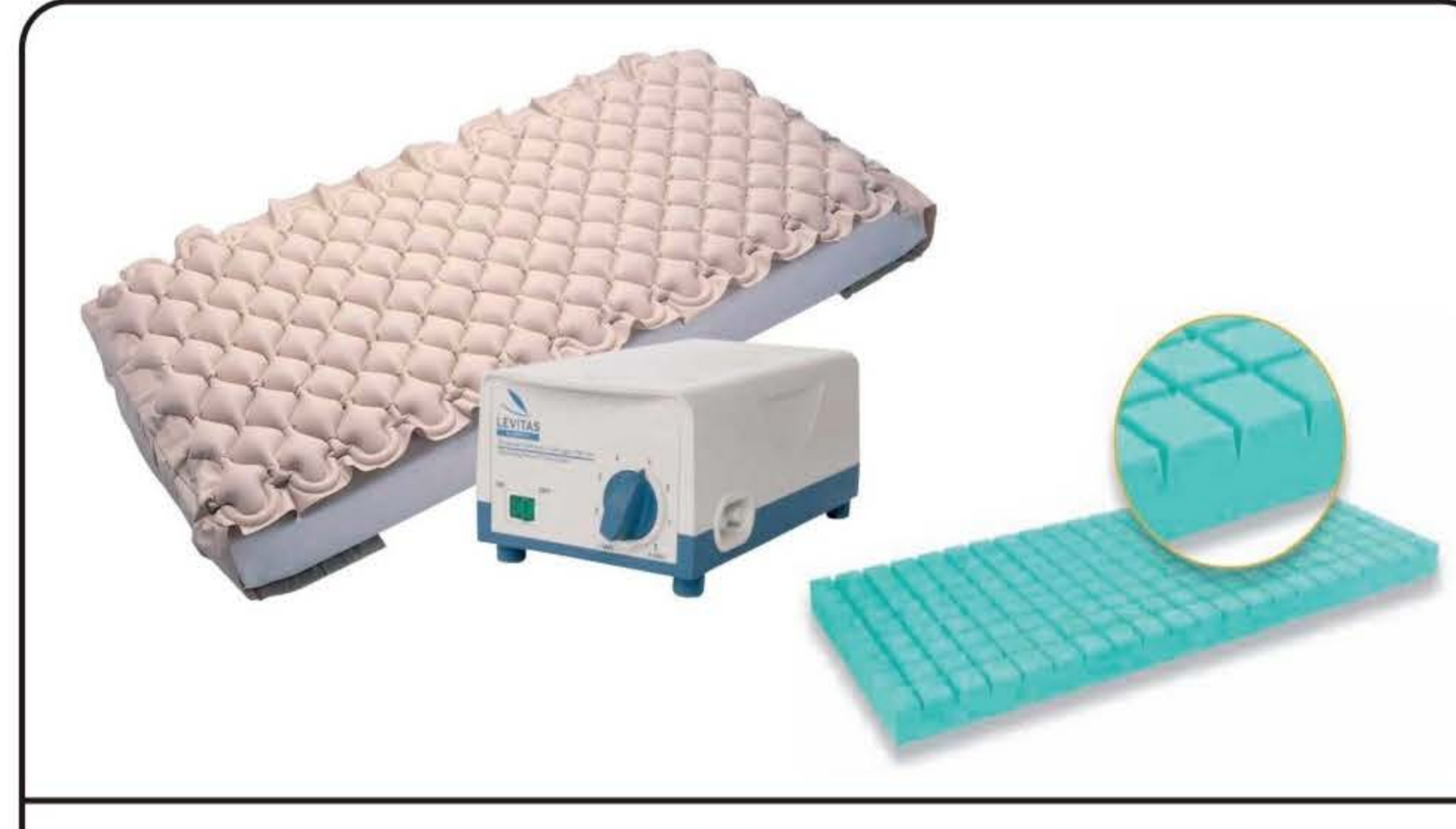
Materasso ventilato antidecubito con compressore e in materiale espanso