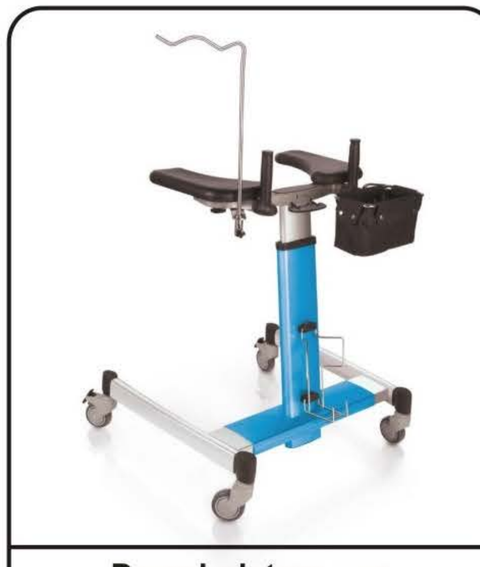
Deambulatore con regolazione a gas