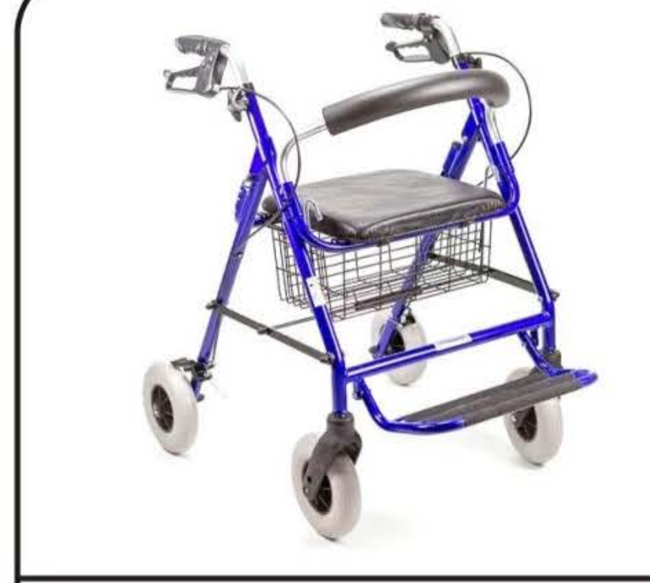
Deambulatore con seduta