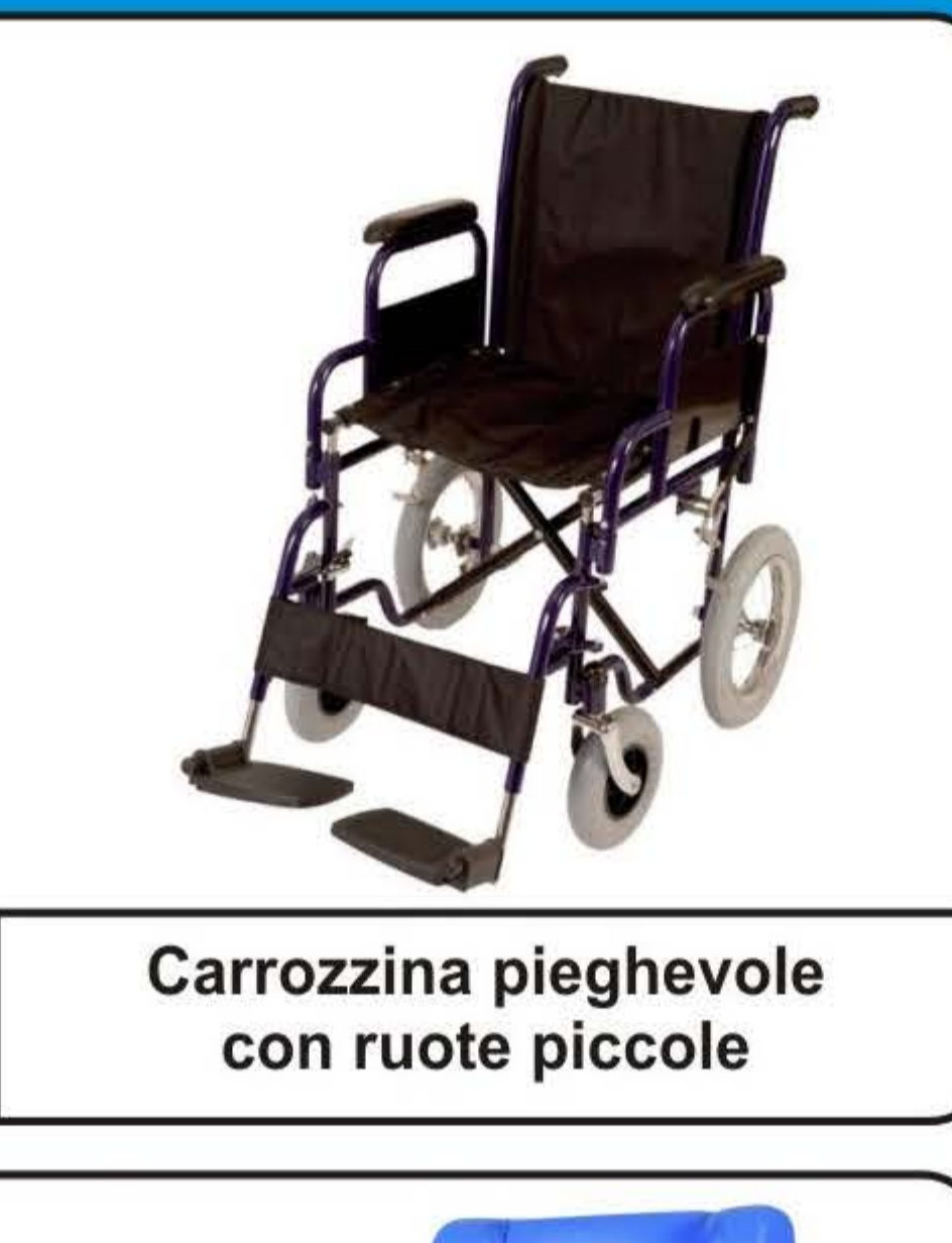
Carrozzina pieghevole con ruote piccole