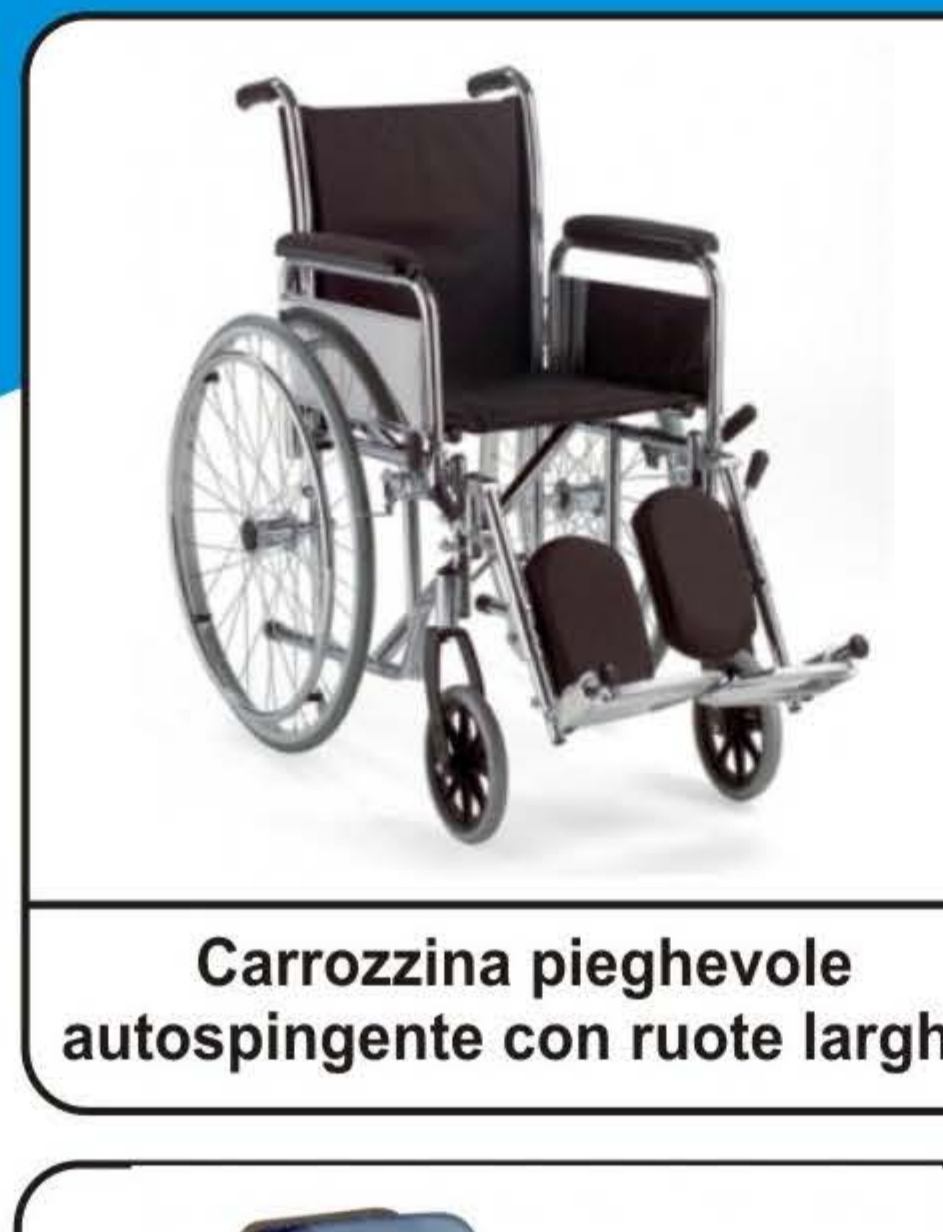
Carrozzina pieghevole autospingente con ruote larghe