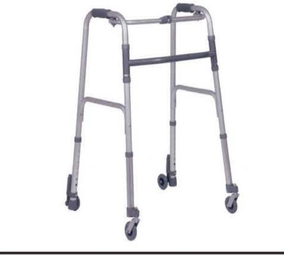
Deambulatore con 4 ruote