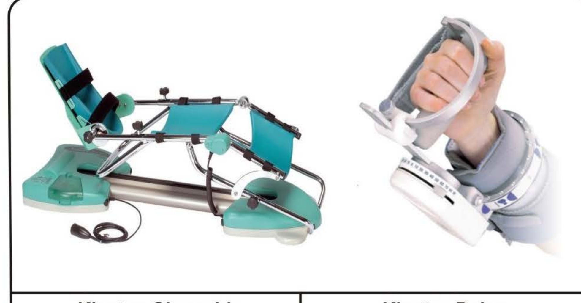
Kinetec Ginocchio Mobilizzazione passiva post-chirurgica