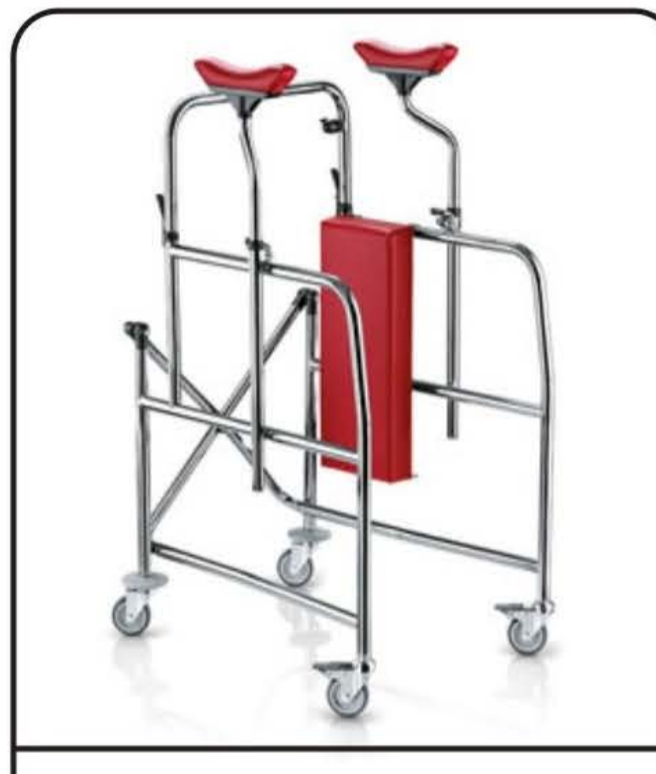
Girello con sottoascellari